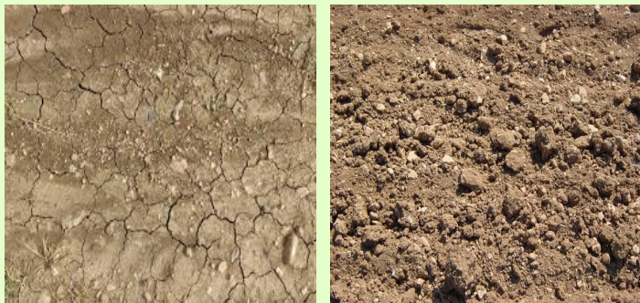
Sol dur et fendillé avant binage

Un inconvénient majeur en période de sécheresse c'est qu'il devient dur et se fendille mais avec l'aide d'une serfouette le binage est le seul moyen de casser cette croûte pour éviter l'asphyxie de la plante.