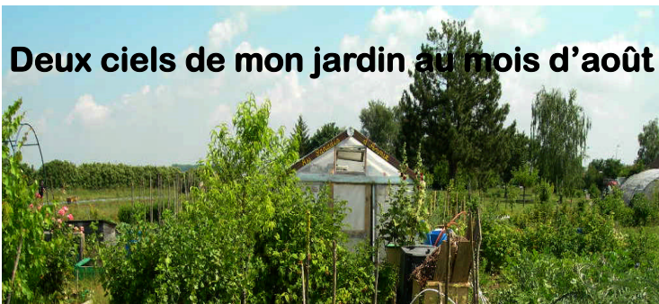
Deux ciels de mon jardin au mois d'août