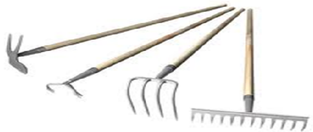
La houe, le cultivateur, le croc ou la griffe, le râteau

Outil très efficace pour briser la croûte après la pluie. Il extirpe facilement les mauvaises herbes très jeunes.