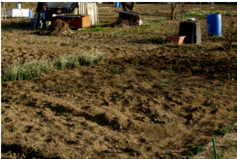
Sol après les gelées