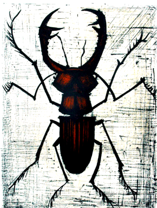
Tableau de Bernard Buffet

Nous, les jardiniers, nous sommes heureux et fiers d'avoir accueilli ces réfugiés et selon notre charte, nous les protégerons. Et, en plus, ils sont si beaux qu'ils ont inspiré les artistes!