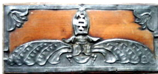
1900- coffret en étain et pierres semi-précieuses